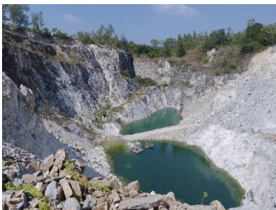
พื้นที่หน้าเหมืองปัจจุบัน