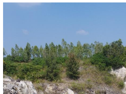
แนวเวนพื้นที่ทำเหมือง