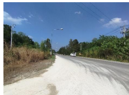
ทางหลวงหมายเลข 3313

ที่มา : แผนที่ภูมิประเทศของกรมแผนที่ทหาร ลำดับชุด L 7018 ราว 4835 /