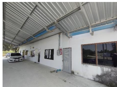
อาคารสำนักงาน