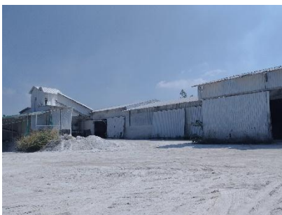
พื้นที่โรงแต่งแร่ของโครงการ